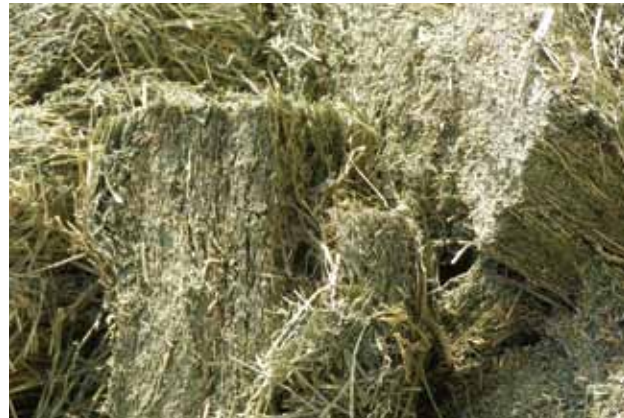
乾草 (アルファルファ)