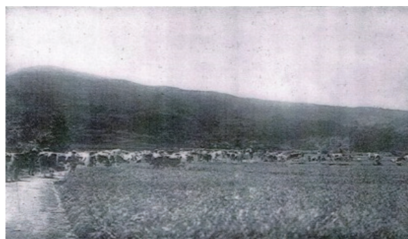
伊豆・丹那盆地の広い牧場で放牧される 乳牛の様子

会員は、婦選獲得同盟から牛乳を買えば女性の境遇改善に貢献できるとあって、伊豆の牛乳である「三島牛乳」を競って買いました。婦選獲得同盟が畜産組合と最初に契約した時、1日1合瓶の牛乳を300本以上婦選獲得同盟が売り上げれば、手数料率を上げるという内容になっていました。ところが発売2ヶ月後には、すでに1日500本以上の契約を取っていました。婦選獲得同盟は、牛乳販売事業の売上好調により手数料率が上がり、活動資金獲得に大きく前進しました。