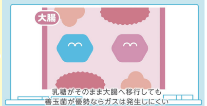
乳糖がそのまま大腸へ移行しても 善玉菌が優勢ならガスは発生しにくい