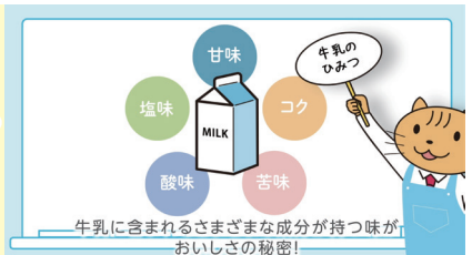
牛乳に含まれるさまざまな成分が持つ味が おいしさの秘密!