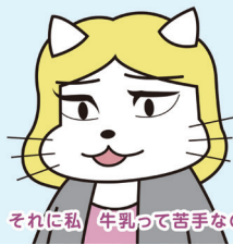
それに私、牛乳って苦手なの