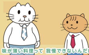
味が薄い料理って、我慢できないんだけど