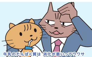
牛乳のたんぱく質は、消化が悪いってウソ