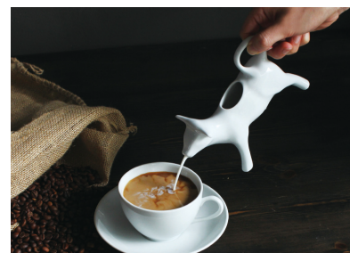
牛型ミルクピッチャー (*4)