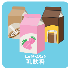
にゅういんりょう 乳飲料