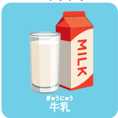
ぎゅうにゅう 牛乳