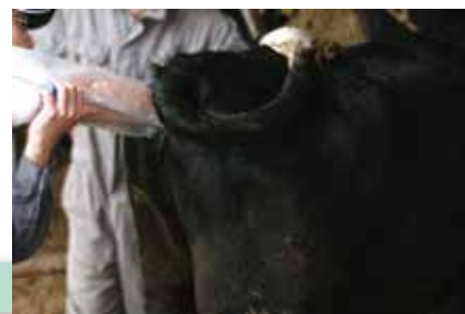
図1 乳用後継牛増頭対策のイメージ